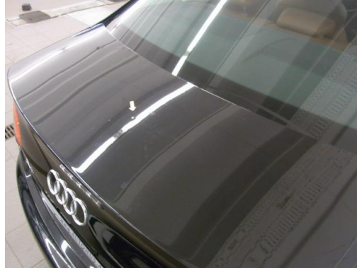
6. Heckdeckel Delle smartrepair