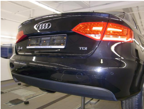
7. Stoßfänger hinten Kratzer smartrepair