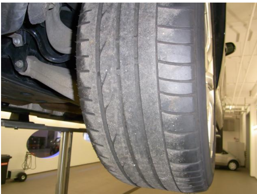
1. Sonstiges Reifen HA abgefahren ern.

Hierbei handelt es sich um kein technisches Funktionsprotokoll bzw. -gutachten.