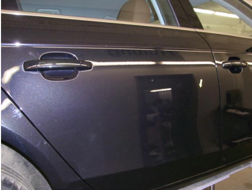
4. Tür hinten rechts Kratzer smartrepair