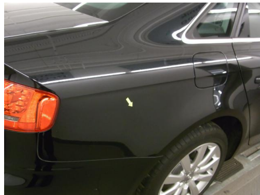
3. Seitenteil rechts Kratzer smartrepair